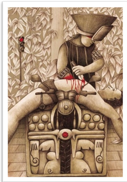
Mircalla LaRouge, en Deviantart , Ilustración para el relato "La noche boca arriba" de Julio Cortázar.